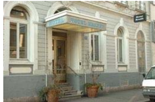
Das Hotel Krafft in Basel.

Basel. SDA/baz. Das am Rhein in Basel gelegene Hotel Krafft ist vom Internationalen Rat für Denkmalpflege (ICOMOS) zum «Historischen Hotel des Jahres 2007» gekürt worden. Weitere Auszeichnungen gingen nach Lugano, Münstair GR, St. Gallen, Wolfertswil SG und Bergün GR.