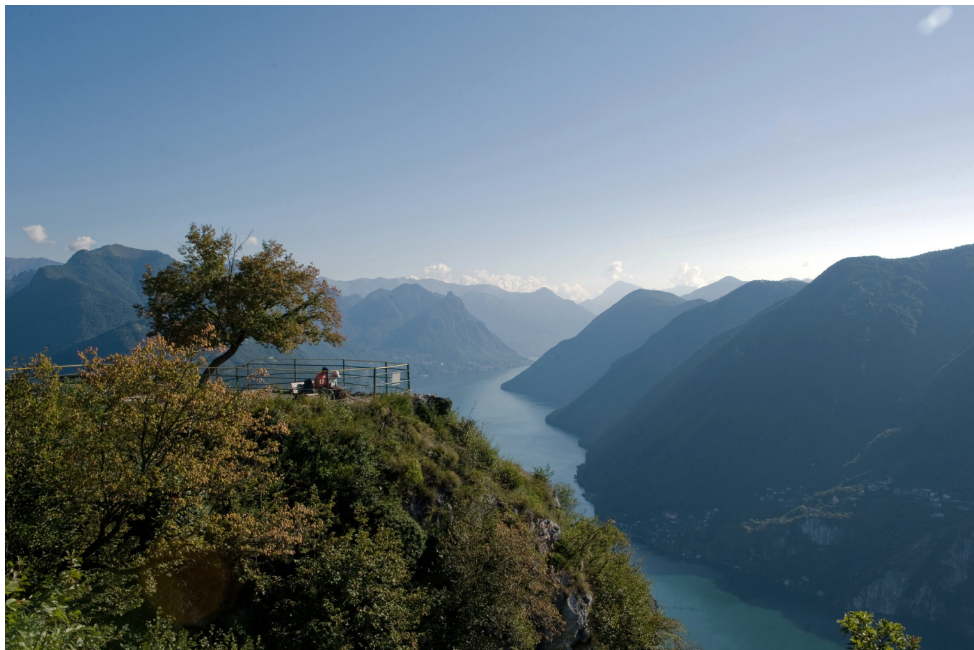
Monte San Salvatore, with its slightly bulbous profile, is known as the Sugar Loaf of Lugano.

head upstairs to a multiroom cocktail lounge (specialty cocktails, 10 to 15 Swiss francs) that can handily occupy your evening from suppertime to almost sunrise.