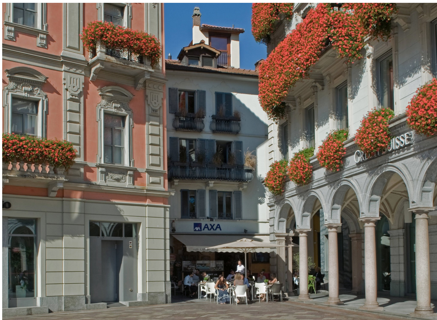
Caffé Caruso, a tiny boîte that's known for excellent Italian-style coffee, as well as cocktails.

Walk off the meal with a stroll to Caffé Caruso, a tiny boîte tucked into a corner of Piazza Riforma that's known for excellent Italian-style coffee as well as cocktails — Aperol spritzes (9 Swiss francs) were in particular abundance this past June. If the spirits move you to keep going, follow the crowds migrating to Seven, the late-night club at the Casino di Lugano that pulsates til 5 a.m.