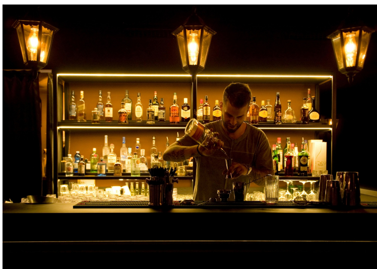
A bartender prepares a drink at Auberge, a cozy bistro that features items like salads, ceviches and tuna and shrimp tartar.

New watches, like new cars, tend to lose between 20 to 30 percent of their value the minute they leave the lot (or the shop in this case). Especially if you are looking for a watch to wear for a few years and then trade in when styles change, it might make sense to start off in the secondhand market. Within about 300 yards of each other in Lugano's tony pedestrian shopping lanes are three pre-owned watch purveyors worth checking out for personal timepiece enthusiasts. Davide Parmegiani is the most high-end with a curated selection of rare limited-edition watches) by Panerai, Patek Philippe, and other top-tier brands. Nearby Watch Center and Taleda offer a wider range of brands, models and prices.