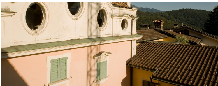
The Hermann Hesse Museum provides a vivid sense of the Nobel laureate's cosmopolitan sensibility amid remnants of his simple country life.