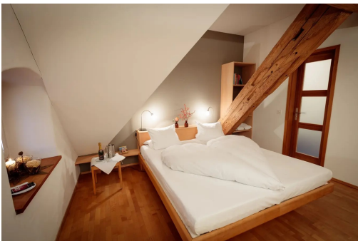
Viel Holz und Weiss dominieren in den Zimmern.

« Schloss Wartegg » am Rorschacherberg ist mehr als ein Hotel, es ist ein Gesamtkunstwerk. Ausgezeichnet haben wir es nicht zum ersten Mal, aber egal welchen Aspekt wir im jeweiligen Rating der Schweizer Hotels aufgreifen, immer gibt es Bemerkenswertes zu berichten über dieses Haus. Erbaut wurde das stattliche Anwesen bereits 1557 vom bischöflichen Vogt Kaspar Blarer von Wartensee. Hotelgäste erschienen allerdings erst sehr viel später, um etwa den 130 000 Quadratmeter umfassenden Park zu erkunden. Im Kräuter- und Gemüsegarten werden Pro-Specie-Rara-Sorten gepflegt. Auch diese gehören zur gelebten Historie.