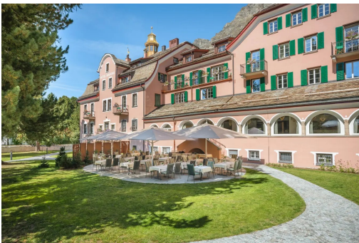
Der schöne Garten vor farbenfroher Fassade.

Die Geschichte des Parkhotel Margna in Sils geht bis 1817 zurück. Einmal war es ein Romantikhôtel, heute ist es ein Parkhotel. Von 2017 bis 2021 wurde es renoviert. Auf den ersten Blick wirkt nun vieles modern und sehr komfortabel mit dem Wellnessbereich und dem kleinen Golfplatz. Womit das Haus aber am meisten punktet, ist die herzliche Betreuung durch das Ehepaar Seiler, die gemütliche Atmosphäre in den Restaurants. Selbst für Hundebesitzer hat es einen Platz. Das «Margna» schafft den Spagat, Altes mit Neuem zu verbinden.