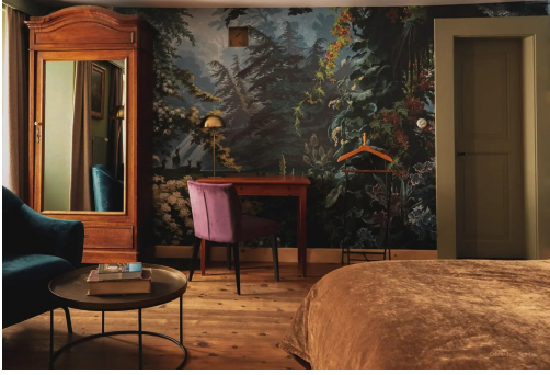
Die Zimmer sind mit Liebe zum Detail eingerichtet.