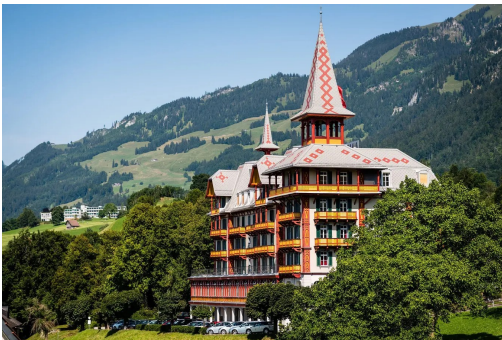
Die ikonischen Türmchen des «Paxmontana».

Ausblick gefällig? Auf den Turm kann hinaufsteigen und einen 360-Grad-Rundumsicht geniessen, wer die Turm-Suite im «Paxmontana» gebucht hat. Zu den Attraktionen des 1896 erbauten Jugendstilhauses in Flüeli-Ranft gehört ausserdem der historische Speisesaal, dessen 47-Meter-Fensterfront nach draussen verbindet. Dass für Bankette und Seminare gesorgt ist, hat sich herumgesprochen, aber kaum jemand weiss, dass das Hotel zu Beginn noch als Kurhaus Nünalphorn firmierte oder die Kalbsleber im Silbergeschirr wie vor 127 Jahren serviert wird.