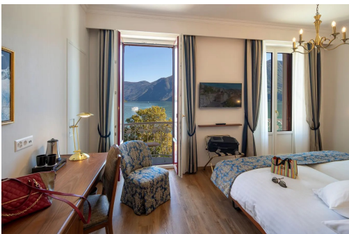
Komfort und Ausblick im «International au Lac».

Die fünfte Hoteliergeneration der Familie Schmid wächst gerade heran im « International au Lac » in Lugano, einem Haus, das seine Geschichte auf aussergewöhnliche Weise zelebriert. Zur Feier des 100-jährigen Bestehens wurde 2006 gar ein kleines Museum im 1. Stock eröffnet. Doch eigentlich ist das gesamte Hotel als bewohnbare Ausstellung zu bezeichnen. Kunst an den Wänden wird hier mit modernem Komfort (Tiefgarage samt Ladestationen) und Entspannung (der Garten hat einen Pool) verbunden. Ganz besonders ist das historische Belle-Époque-Doppelzimmer.