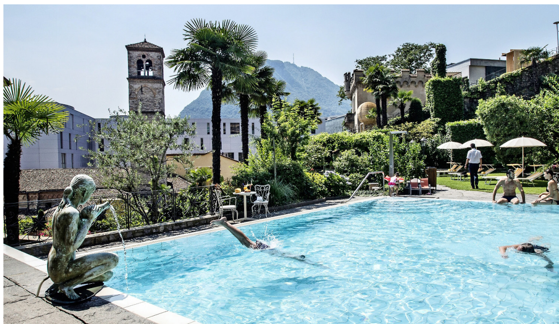
Einzigartig: Das International au Lac punktet mit einem Pool mitten in der Stadt.

Seit 125 Jahren fährt die Zahnradbahn von Capolago auf den Monte Generoso. Auf dem 1704 Meter hohen Gipfel sieht man über die Jungfrau bis zum Monte Rosa und dem Gotthard. Im neuen Bau «Fiore di pietra» des berühmten Architekten Mario Botta befindet sich ein Restaurant mit 360-Grad-Aussicht. Auf dem Berg kann man wandern, mountainbiken und gleitschirmfliegen. CLA