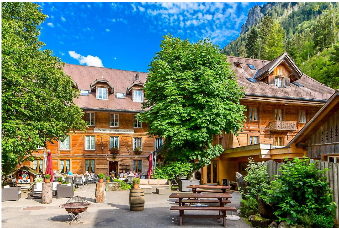
Gastfreundschaft in 6. Generation gibts im Hotel Kemmeriboden-Bad.