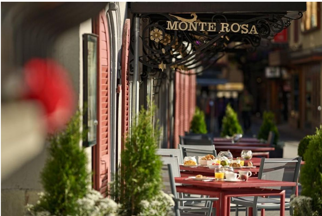
Sonniges Frühstück, serviert vom Hotel Monte Rosa in Zermatt.