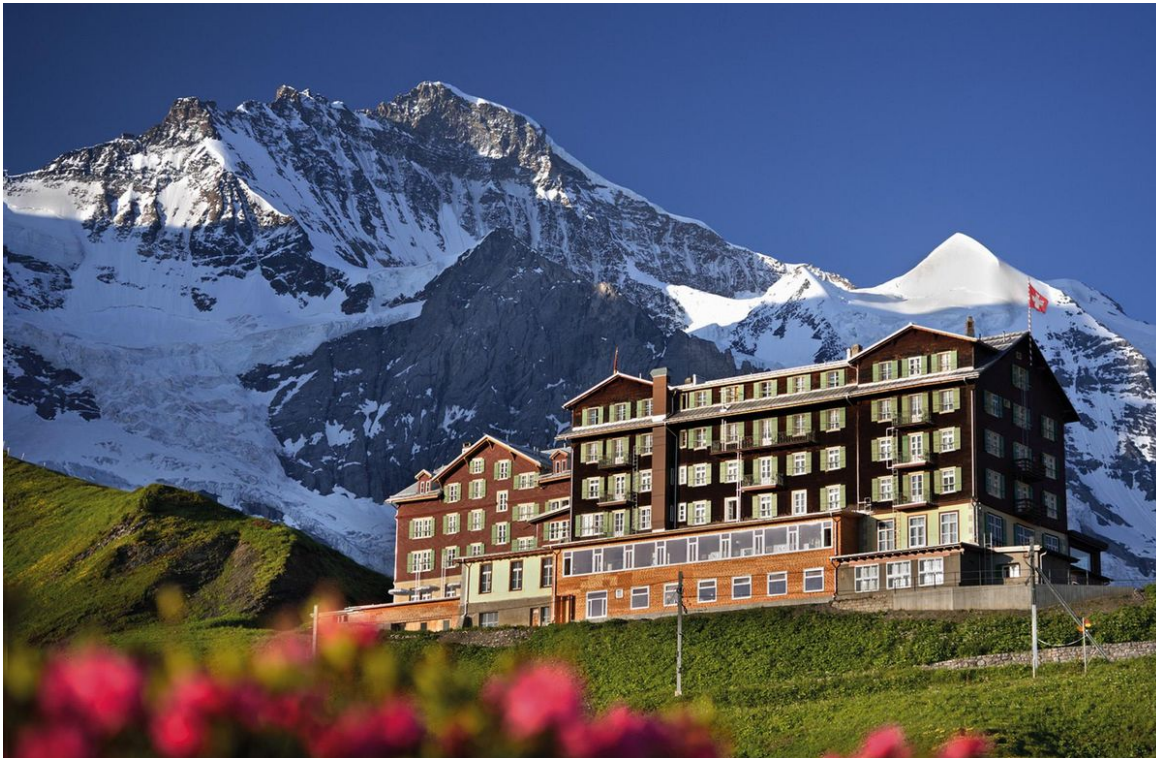
Das Bellevue des Alpes auf der Kleinen Scheidegg war das erste Berghotel an dieser Stelle.

Referenz: 77500052 Ausschnitt Seite: 6/8