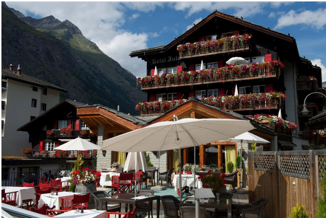
Die Julen Hotels werden in dritter und vierter Generation geführt.