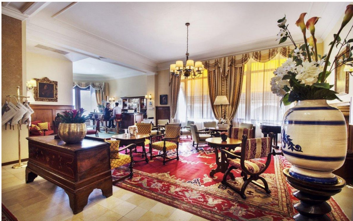
Viel Geschichte, aber auf dem neusten Stand: Die Blues Bar im Hotel International au Lac in Lugano.