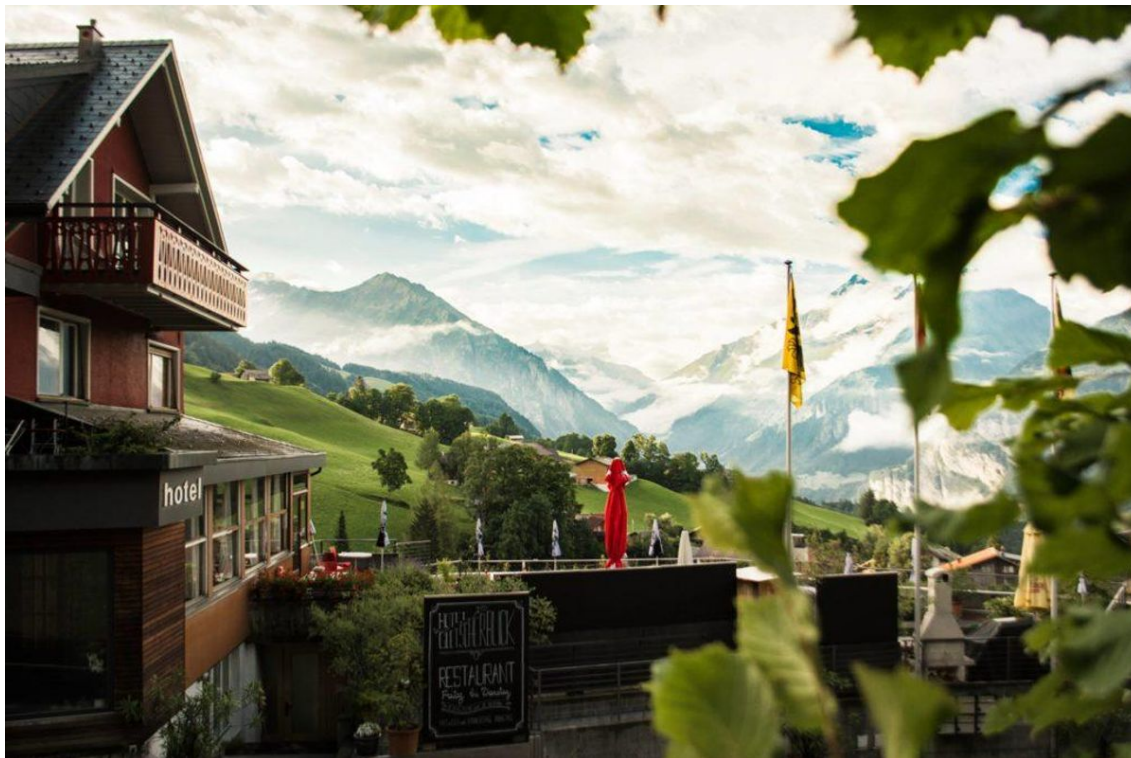
Im Hotel Gletscherblick ist der Name Programm – auch in vierter Generation.

Referenz: 77500052 Ausschnitt Seite: 8/8