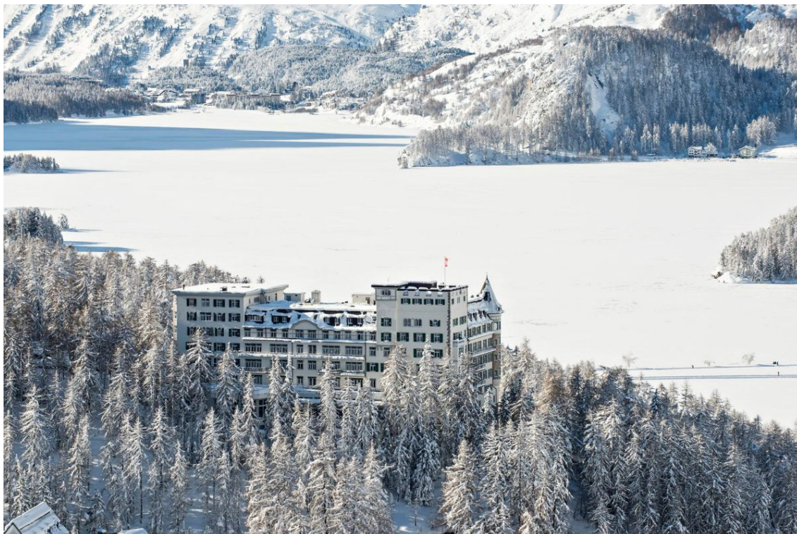
Das Hotel Waldhaus in Sils-Maria feiert gerade sein 111-jähriges Bestehen.