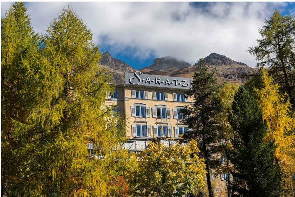
Vom Heustall zum Hotel: Das Saratz in Pontresina.