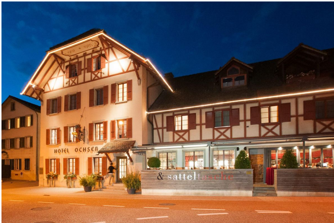
Vor wenigen Jahren auf 36 Zimmer erweitert: Das Hotel Ochsen in Lenzburg.

Referenz: 77500052 Ausschnitt Seite: 5/8