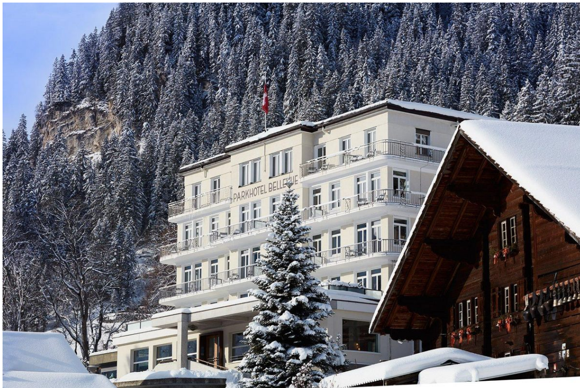
Von Anfang an in weiblicher Hand: Das Bellevue Parkhotel & Spa in Adelboden.