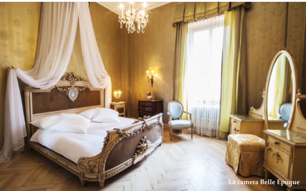
La camera Belle Epoque