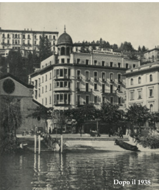
Dopo il 1938