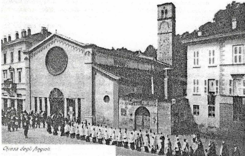
Chiesa degli Angioli.

Gli ottant'anni dell'Albergo «International-au-Lac»